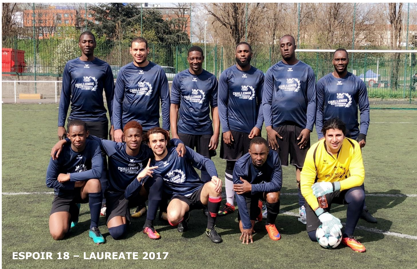
ESPOIR 18 – LAUREATE 2017